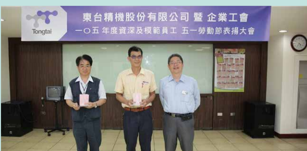
▲服務年資滿二十五年員工合影