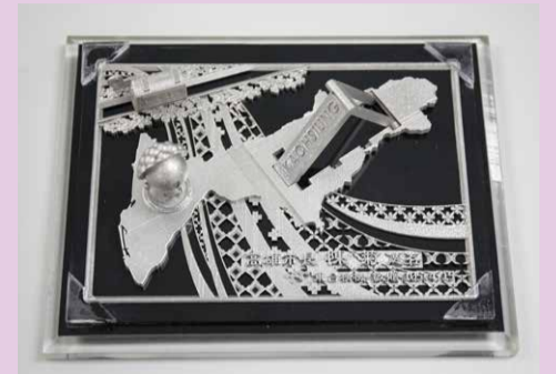
▲致贈給陳菊市長的禮品-「印泥手機名片座」，由先進技術部同仁創意發想，並利用東台AM250機台製作

示肯定，且期待東台繼續擔起工具機產業領頭羊角色，不論在金屬加工或非金屬加工領域，皆能發揮技術能量，繼續為台灣產業盡一份心力。