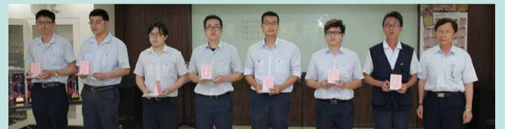
▲服務年資滿十年員工合影