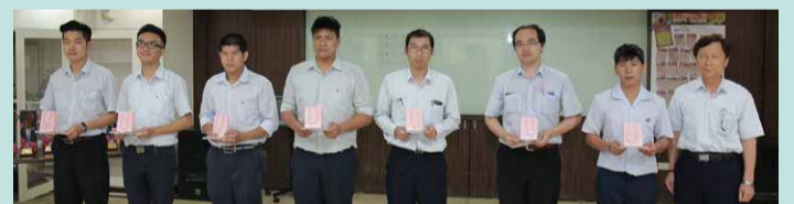
▲服務年資滿五年員工合影