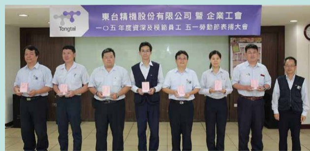
▲服務年資滿二十年員工合影