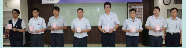
▲服務年資滿十五年員工合影