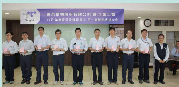
▲服務年資滿十五年員工合影